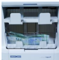
Geräusch- und Staubklappe