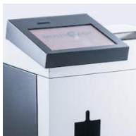
MSS 14 sort touch