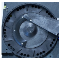
Geräuscharmes Förderteller mit Reinigungslöchern