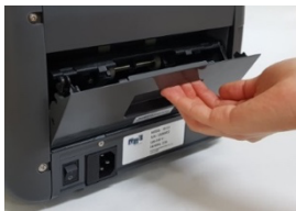
Einfach zu öffnen