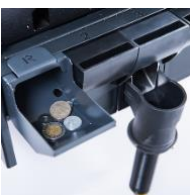
Reject-Tasse mit Beutelhalter