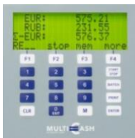
Dialogdisplay mit Dualanzeige